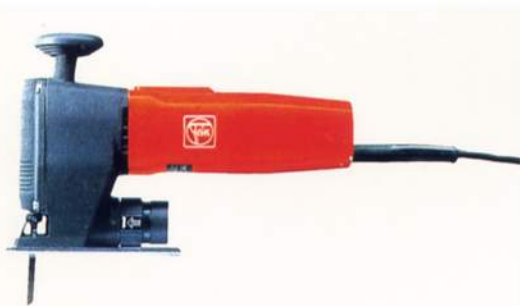
ファイン電子ジグソー