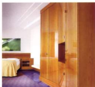
高級家具の仕上げにも