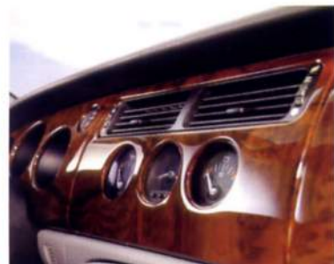
自動車のパネルやボデーの仕上げにも