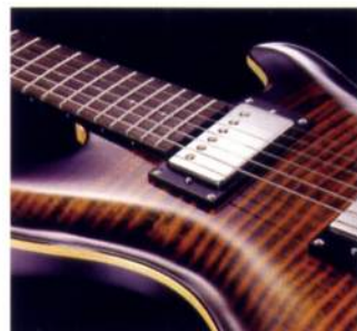
楽器の仕上げにも