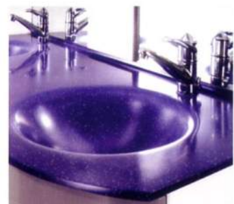
人造大理石の仕上げにも