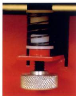
テーブルの高さを簡単に 変えられるノブ付きネジ

このテーブルドラムサンダーはテーブルの中央部にサンディングペーパーを巻き付けたドラムを設け、そのドラムが回転することにより、テーブル上を移動させた材料の下面をサンディングします。小物の面取りやバリ落とし(糸のこで切った材料の裏面など)がすばやくできます。ベルトサンダーと違って接触面が小さいので材料が飛ばされるようなことはなく、またかな盤のように刃物が回転していないので非常に安全です。