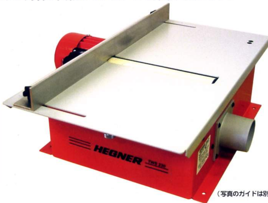
(写真のガイドは別売品です)