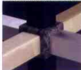
加工が難しい部分に