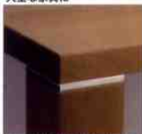
テーブルの脚の組み立てに