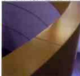
パイプが使えない場所に