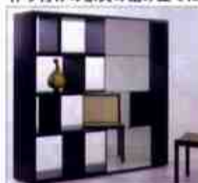
現場組み立ての必要な家具に