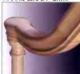
複雑な形状のインテリアに