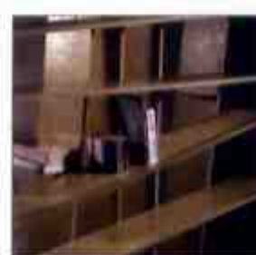
作り付けの家具の組み立てに

ラメロ社製品輸入総代理店 テクノトゥールズ株式会社 〒208-0035 東京都武蔵村山市中原1-30-10 電話: 042-569-1502 ファックス: 042-569-1572 e-mail: info@techno-tools.co.jp URL: http://www.techno-tools.co.jp