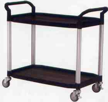
RA-808LE-3 ホワイト2段シェルフ 12.5kg